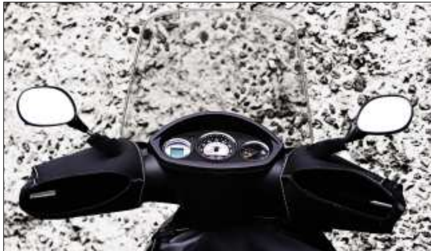
MANCHONS FOURRÉS ET TABLIER SOUPLE La protection maximale par temps hivernal.